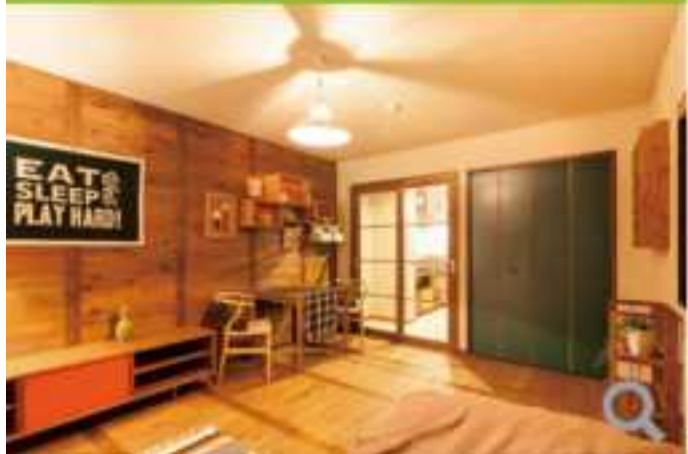
賃貸アパートマンション