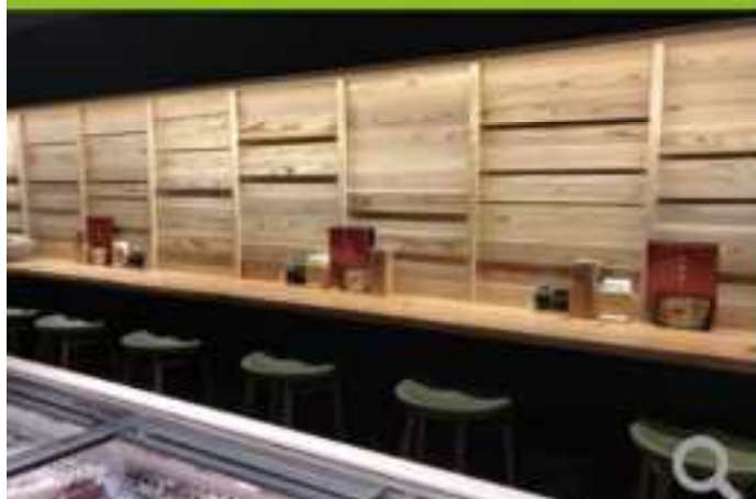
店舗（店舗兼住宅含む）