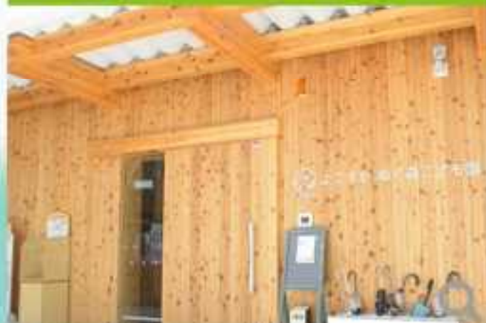
社会福祉施設（高齢者・子育て支援）